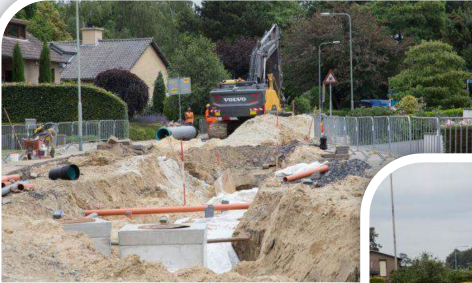
Impressie werkzaamheden (Nieuwstadt fase 1)